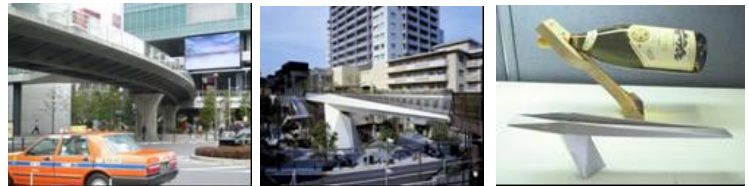
AKIBA Bridge (秋葉原) 代官山2号橋 (代官山) ワイン立てからのヒント