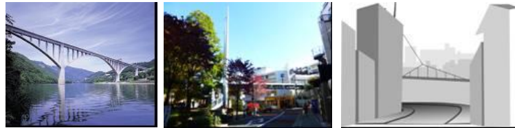
池田へそつ湖大橋 (徳島県) 代官山1号橋 (代官山) 狭隘な道路景観でのフォルム