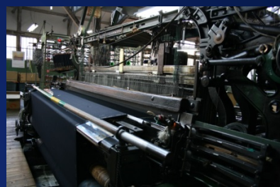
①ションヘル式織機