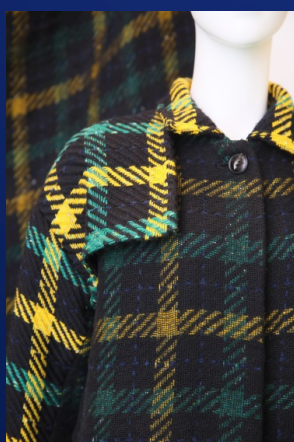
④金氏によるグランプリ受賞作品