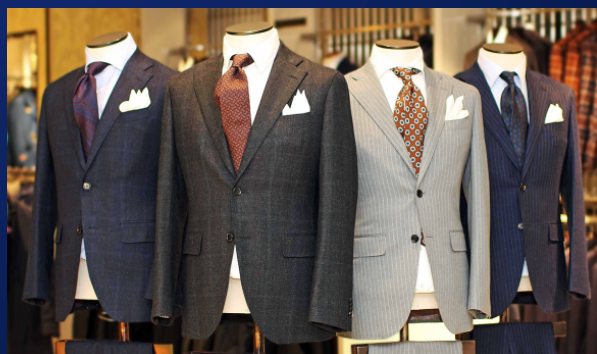
⑤葛利毛織の三越伊勢丹別注スーツ

http://www.mistore.jp/brand/story/20161114/index.html