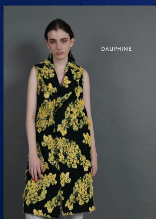
③足立氏による作品