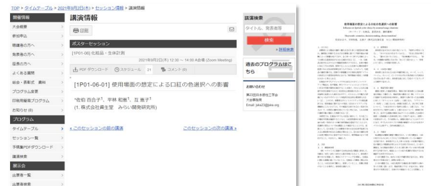
ポスターセッション会場